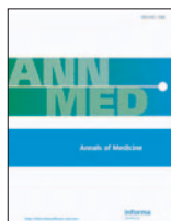
Annals of Medicine 46(5-6):311-317, Ago 2014