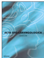
Acta Oto-Laringologica 134(9-10):982-989, Sep 2014