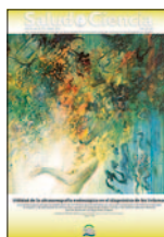
Salud i Ciencia 20(4):424, Mar 2014