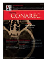
Revista del CONAREC 28(117):345-348 Dic 2012