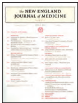
New England Journal of Medicine 370(1):13-22, Ene 2014