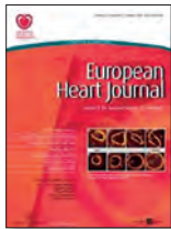
European Heart Journal 34(28):2159-2219, Jul 2013