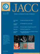
Journal of the American College of Cardiology 63(1):62-70, Ene 2014