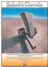
Salud(i)Ciencia 19(8):723-727, Jul 2013