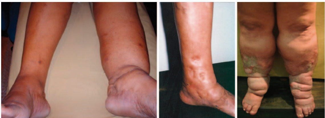
Figura 1. Pacientes con linfedema.

El linfedema se clasifica como primario o secundario según su etiología. El primario representa la deficiencia vascular linfática del desarrollo, que puede ser congénita o hereditaria. El linfedema secundario es el adquirido, hay un proceso que lo causa. Siempre hay formación de fovea al comprimir el área perimaleolar o puede haber daño en la piel (Figura 1).