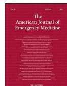
American Journal of Emergency Medicine 36(10):1759-1765, Oct 2018