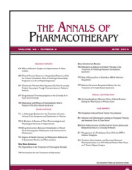
Annals of Pharmacotherapy, 1-7, Oct 2020