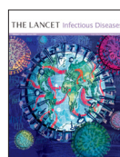
The Lancet Infectious Diseases 19(5)477, May 2019