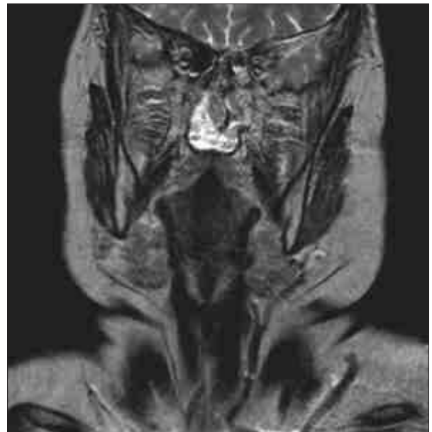
Figura 1. Tumoración de la región anterior derecha de la nasofaringe, sin infiltrar ni adenomegalias.

Se remite al Servicio de Hematología para completar su estudio, que solicita bioquímica, proteinograma, células plasmáticas y gammagrafía ósea que resultan normales. La cuantificación de inmunoglobulinas es normal, los exámenes de inmunofijación (IF) y cadenas ligeras libres (CLLs) son negativos, la punción aspirativa de médula ósea no detecta infiltración