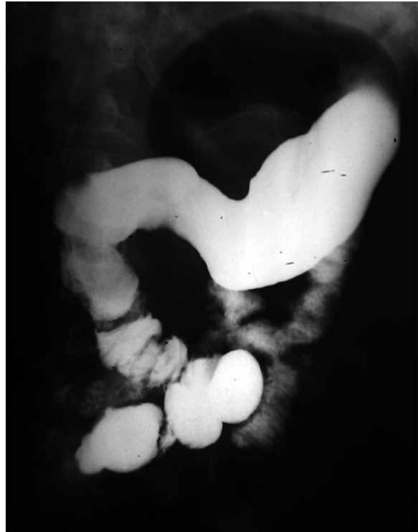
Figura 1. Imagen de linfoma intestinal en ileon proximal, donde se observa separación, rigidez y dilatación de proximal de asa.

El empleo de técnicas contrastadas como método auxiliar durante las EDB resulta un recurso muy práctico e interesante, puesto que aumenta la sensibilidad del estudio