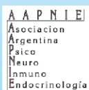
Asociación Argentina de Psiconeuroinmunoendocrinología (AAPNIE)