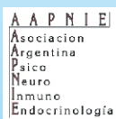
Asociación Argentina de Psiconeuroinmunoendocrinología (AAPNIE)